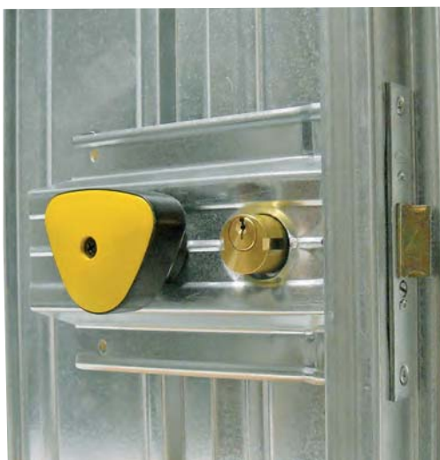
montaggio maniglia allarmata su porta cantina