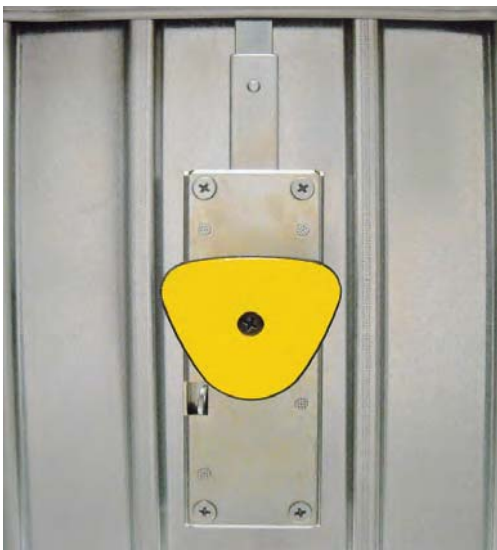
montaggio maniglia allarmata su porta basculante